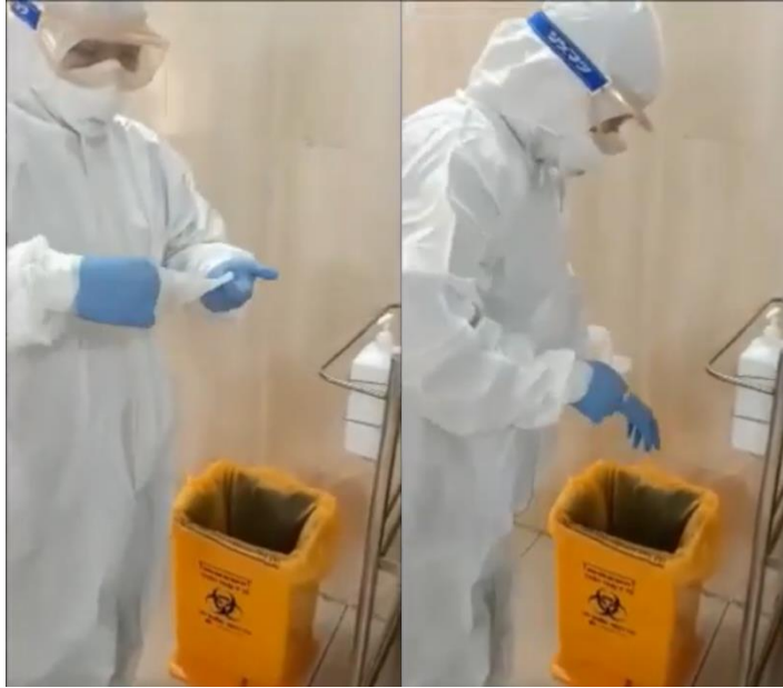
Bước 2: Vệ sinh tay.