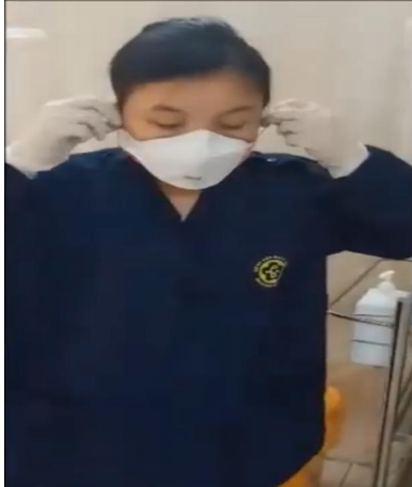
Bước 8: Vệ sinh tay.