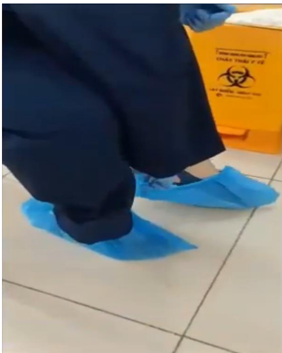
Bước 6: Vệ sinh tay.