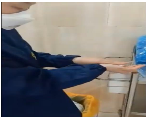
Bước 7: Tháo kính bảo hộ hoặc tấm che mặt.