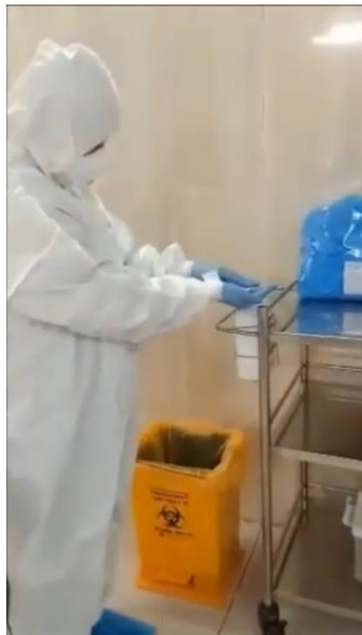
Bước 3: Tháo bỏ áo choàng, cuộn mặt trong của áo choàng ra ngoài và bỏ vào thùng chất thải.